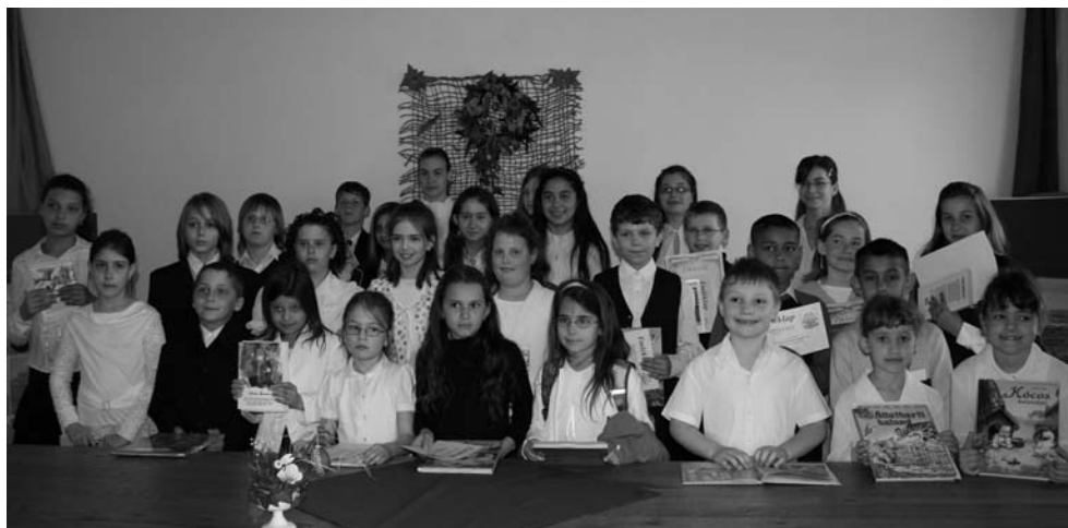
Képünkön a verseny díjazottjai.