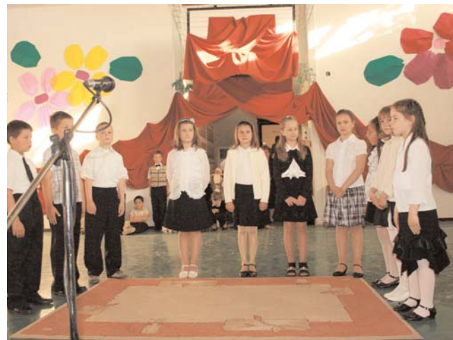
Két kép az Iskola gáláról