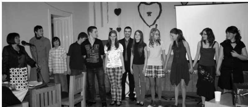
Képünkön: Szíverősítő Orfeum 2012