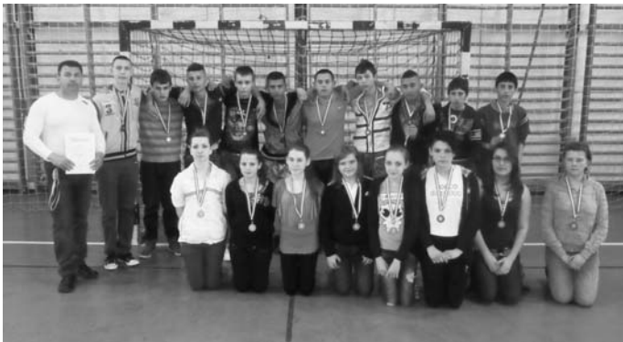
Képünkön a két sikercsapat! Gratulálunk!