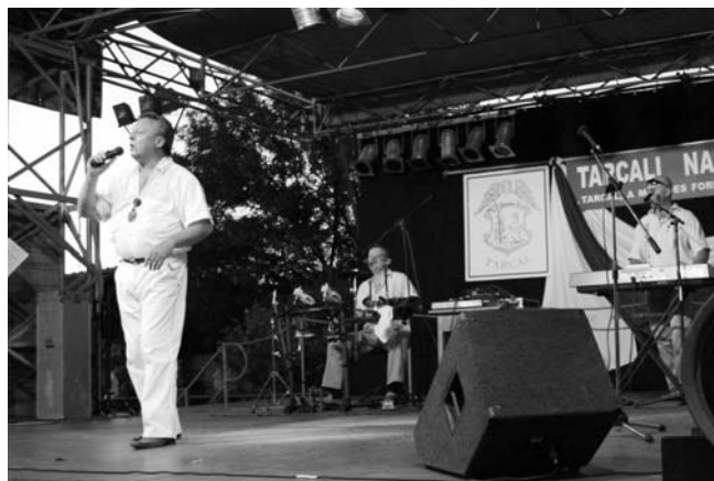
Szuper Dáridó - Havasi György és a Harmónia Duó