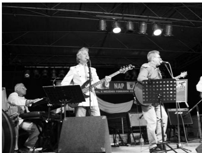
Reflex zenekar koncertje