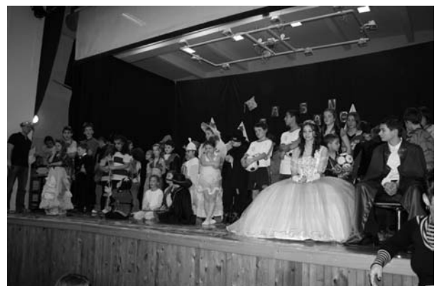
A Hercegi pár és a sok ötletes jelmezbe öltözött gyermek