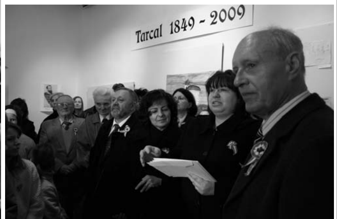
Az emléklapok átadása