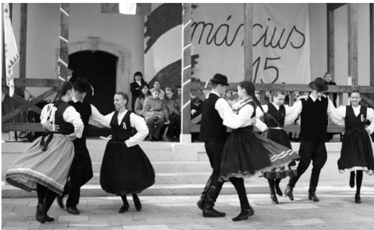
A szintén „Pro Urbe Tarcalért” díjas Tarcali Hagyományőrző Egyesület műsora