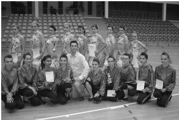
Felső kép: Erős emberek éjszakája, alsó kép a tiszaujvárosi verseny